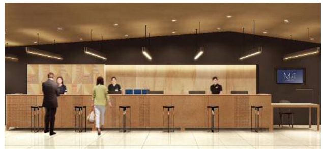
名駅サテライトクリニック（イメージ）

さらに、女性のお客さまには女性専用の診療エリアを設け、女性のためのスタッフによるきめ細かな医療サービスと心温まる空間をご用意するほか、海外からのお客さまのニーズにお応えする一端を担うため、医療ツーリズムとしての健診、各種人間ドック、アンチエイジングドックを提供するなど、総合健診センターを通じて皆さまの健康と医療の発展への貢献に取り組みます。