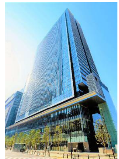
JP TOWER NAGOYA