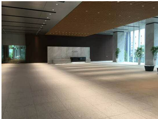
オフィスエントランス

また、高断熱外壁（Low-E ペアガラス）や自然換気システムといった環境負荷を軽減する外装計画に加え、省エネ機器の設置や水処理システムの導入、ステップガーデンの緑化、さらに駐車場棟における太陽光発電パネルの設置、風力発電、屋上緑化・壁面緑化など、次世代のオフィスに求められるさまざまな視点からのきめ細やかな環境対策を行います。