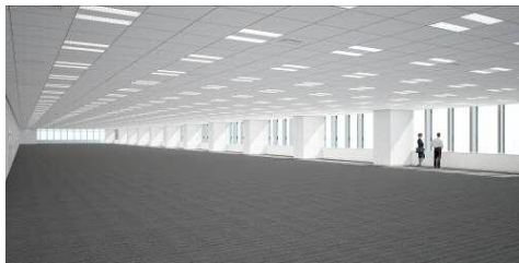
「オフィスフロア」(イメージ)