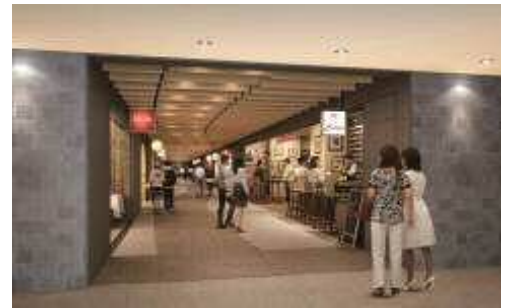
B1 フLOOR (イメージ)

中部圏のビジネスの中心地であり、人や文化が集結する名駅エリアにおいて、「JPタワー名古屋」および周辺オフィスで働く都市感性を持つ就業者と、大人の感覚や感性を持ち、駅、バス、駐車場を経由して集まる、好奇心旺盛なエリア来訪者をターゲットとします。