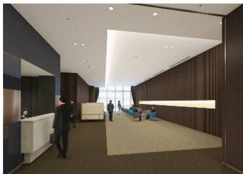
「JPタワー名古屋 ホール&カンファレンス」 (ロビーイメージ)