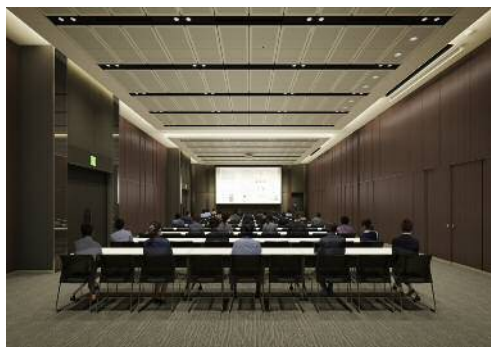
「JPタワー名古屋 ホール&カンファレンス」 (ホールイメージ)