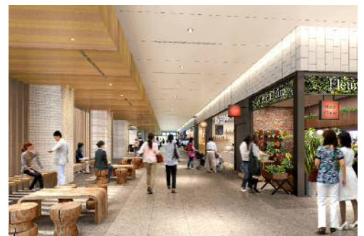
1F フLOOR (イメージ)

出店店舗については、コンセプトである『「名古屋を」伝える、「名古屋に」伝える』を基に、普段使いのしやすいオープン型飲食店や特別な時間を演出する大型飲食店、トレンド感のあるカフェ・ダイニングなどバリエーション豊かな飲食店舗のほか、つい買って帰りたくなるご褒美やお土産などが集まる食物販、こだわりの物販やサービスの店舗などが集まります。