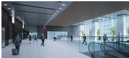
「オフィスエントランス」(イメージ)

基準階のフロアは、エリア最大級となるワンフロア約700坪の使いやすい整形・無柱空間です。